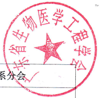
附件 1: 秘书处成员分工一览表